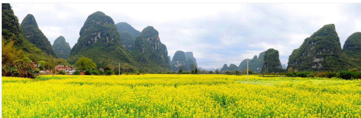
三等奖：宋福坚《油菜花海》

地方特色是地方立法的根本体现，没有地方特色就没有地方立法。因此，律师对于参与地方立法要多注意从地方特色考虑。这样才能帮助立法机关进一步提高地方立法的质量。