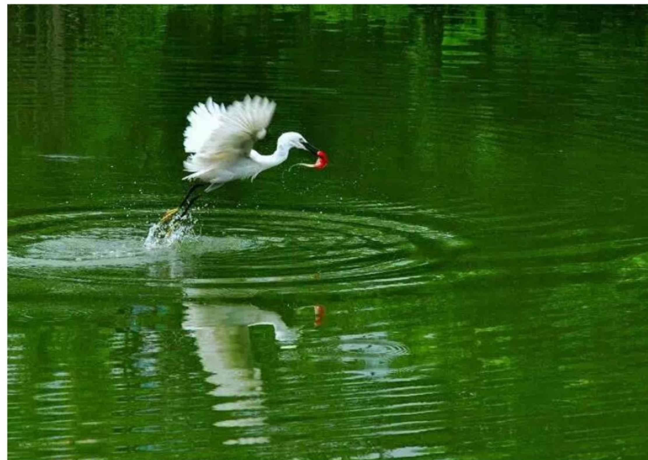
觅食 高级合伙人 刘善巧律师 摄

孙婷婷律师，本所律师，广东财经大学法学士，业务领域为投资并购、企业法律顾问、民商事诉讼仲裁。