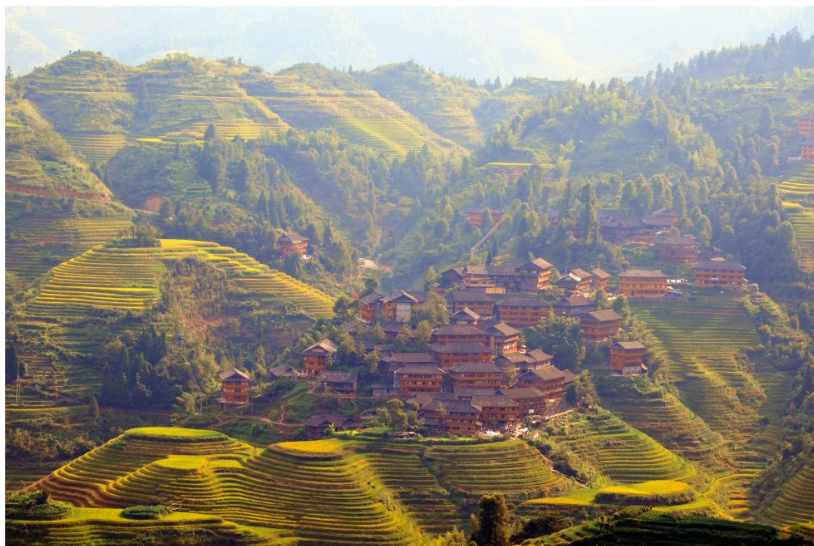
秋日梯田

李骞实习律师，本所实习律师，中华全国专利代理人协会专利代理人。毕业于中南大学应用物理系，在北京理工大学获得管理学学位，华南理工大学获得电子工程硕士学位。曾服务于中国电子信息产业集团华大电子以及清华同方集团同方LED等高新技术企业十余年，担任过技术员、工程师、企业高管。后又在广东创办“梧桐家纺”、“欣绣壁纸”等生产型企业。尤其在处理合同纠纷、债权纠纷、股权纠纷、知识产权纠纷、劳动争议等诉讼业务方面积累了丰富的司法实践经验。