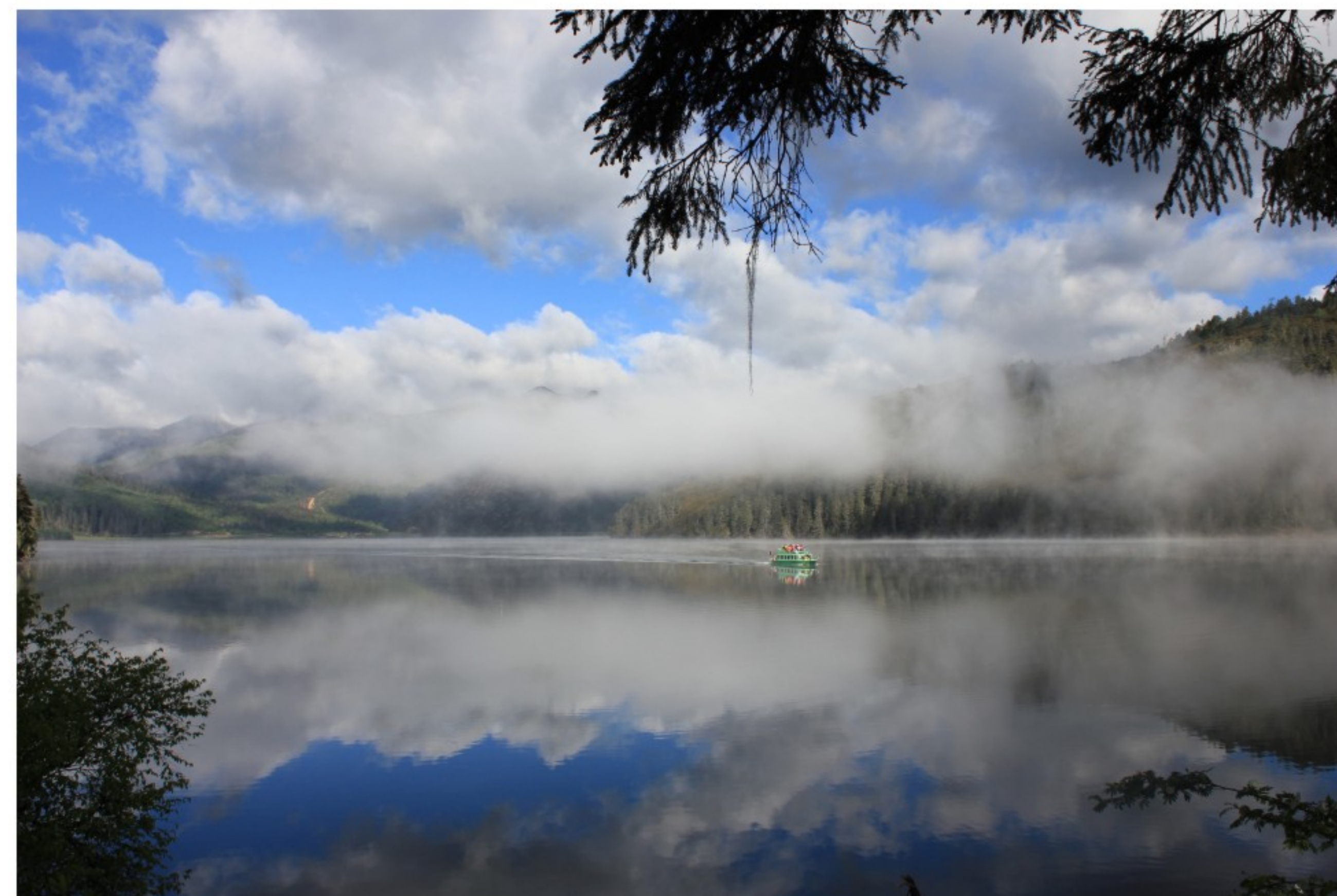
香格里拉 云梦之境

2017年6月8日，广东省知识产权服务标准化技术委员会(GD/TC 123)成立大会暨第一次工作会议在深圳召开，广东广信君达律师事务所陈胜杰律师以广东知识产权保护协会秘书长身份入选为首届广东省知识产权服务标委会委员，并出席了会议。