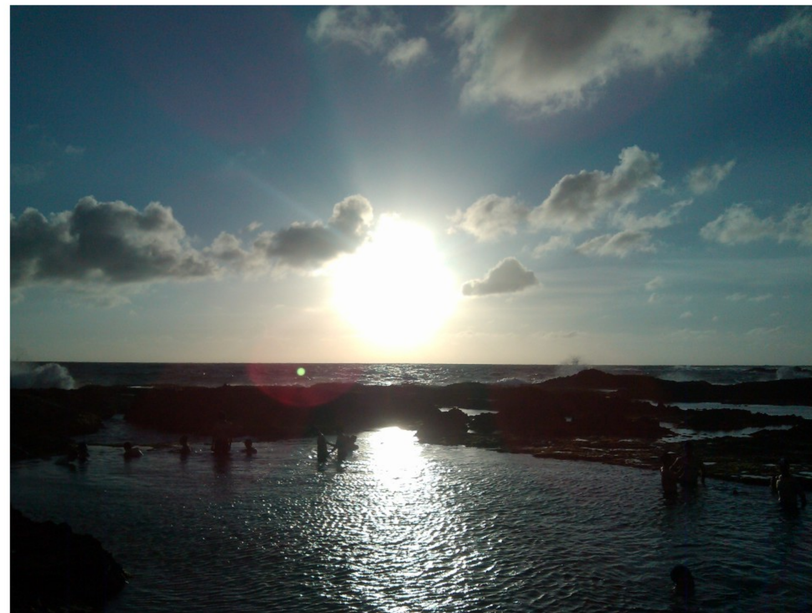
德庆天山

周湘茂实习律师，本所实习律师，湘潭大学诉讼法学硕士，师从中国法学会研究中心主任李仕春教授，专注于刑事辩护，尤其擅长贪污贿赂犯罪和非法集资等经济犯罪的疑难案件辩护。曾在“全国十佳检察院”、“全国模范检察院”从事公诉工作，时间长达五年，主要办理职务犯罪和经济犯罪案件，办案数量累计达到近千件，擅长于敏锐地发现并犀利地剖析案件突破点，同时有着深厚的法学理论功底，为重大、疑难案件提供比较充分的理论支撑。