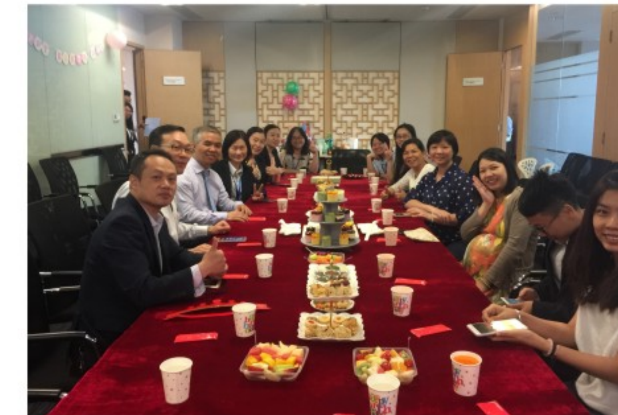
广信君达五月生日会

各位律师和员工需要广信君达的平台，同时，广信君达所也离不开每一位律师和员工。一场场简约而温馨的集体生日会，让律师、员工感受到来自律所的关怀，律所也借此机会对员工们长期以来的辛勤工作给予了充分的肯定，表达衷心的感谢。律所希望，平台展现并不是各位员工与律所之间产生交集的唯一理由，更多的应该是友情和关爱。