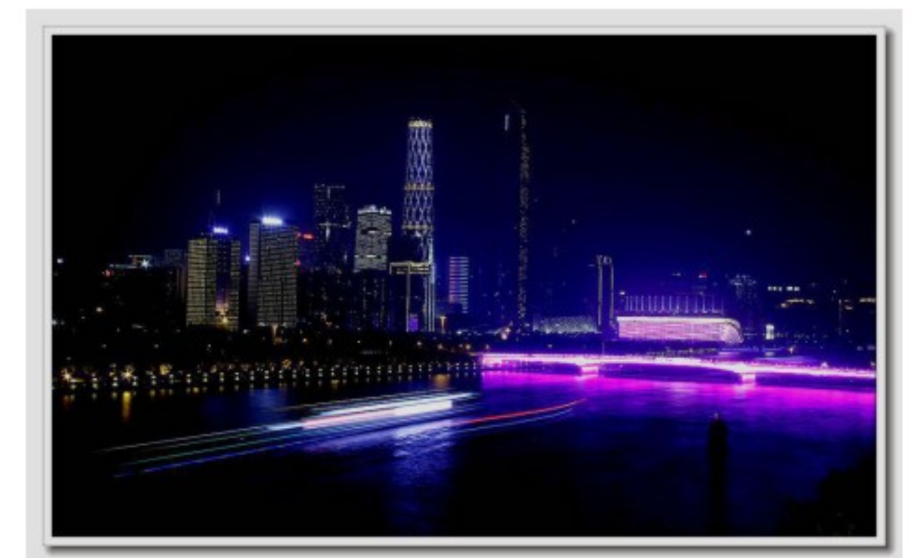
珠江夜景