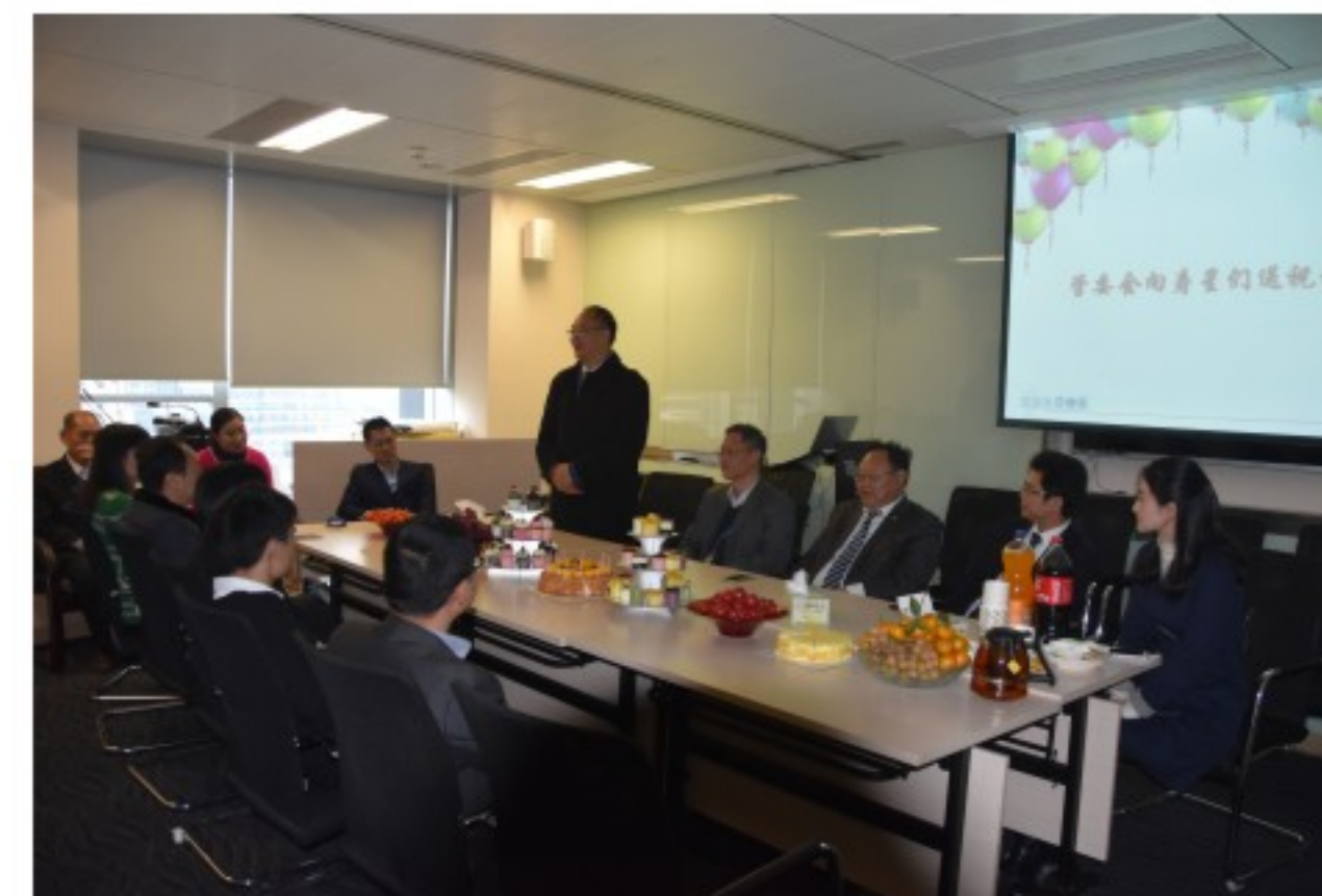
广信君达二月生日会

为加强律所内部文化建设，丰富员工业余生活，建立和谐友爱的律所工作氛围，增强员工的归属感，从2017年2月份起，广信君达为律师、员工们举办了月度生日会，截止目前，本所已成功筹办了4场月度生日会。