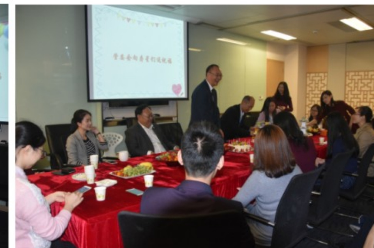
广信君达三月生日会

心中，悦耳感人的生日歌萦绕在广信君达律所的每个角落，大家在温暖的午后一起度过了温馨的时光。