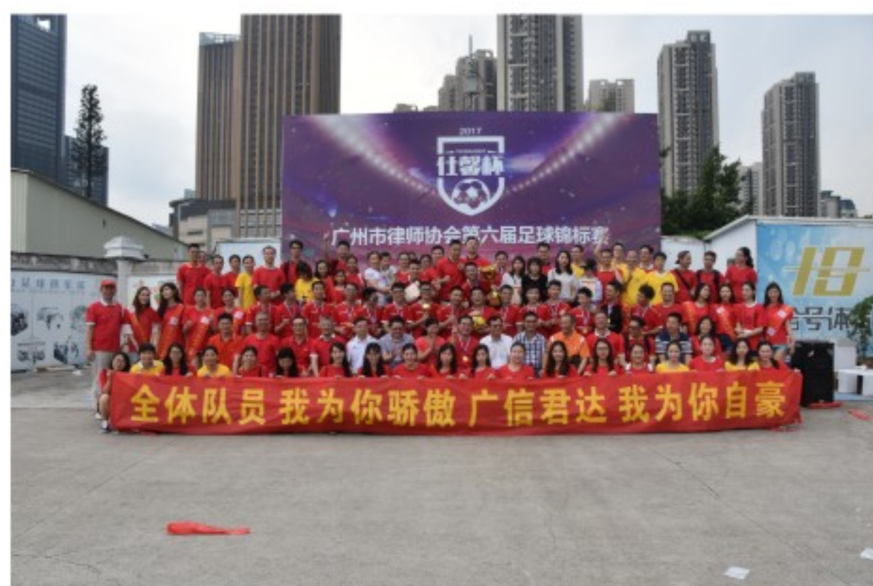
广信君达足球运动健儿 与高级合伙人、拉拉队等合影

2017年4月9日下午4点30分，广州市律师协会第六届足球锦标赛在广州市海珠区拾号体育公园隆重开幕。本届赛事共吸引了29支律师队伍参赛，比赛采用上下半场各30分钟，小组单循环赛与淘汰赛相结合的赛制。赛事从4月9日持续到6月4日，共9轮71场比赛，此次参赛队伍之多、持续时间之久、赛事规模之大，无疑是广州律师界的一场“足球盛宴”。