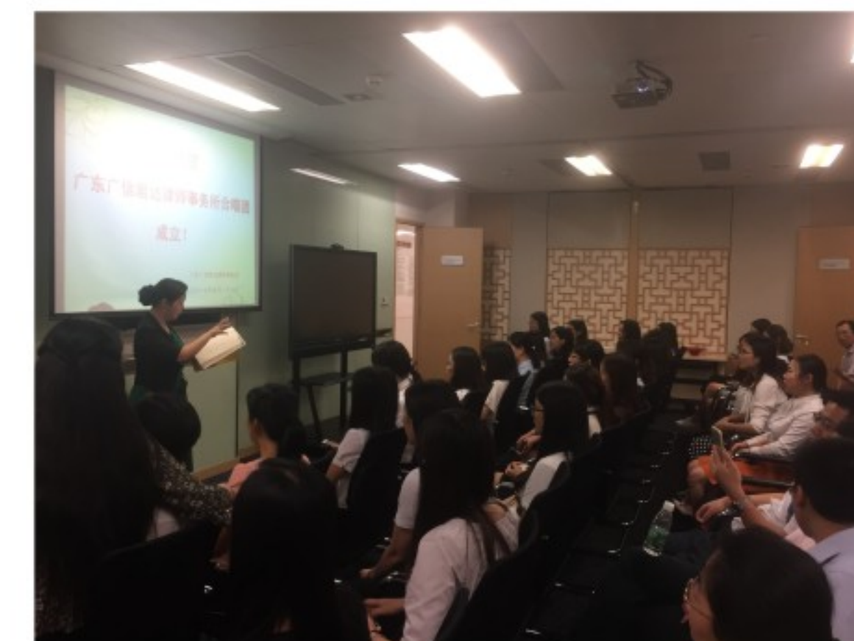
2017年5月26日晚，广东广信君达律师事务所合唱团成立仪式在本所会议室隆重举行