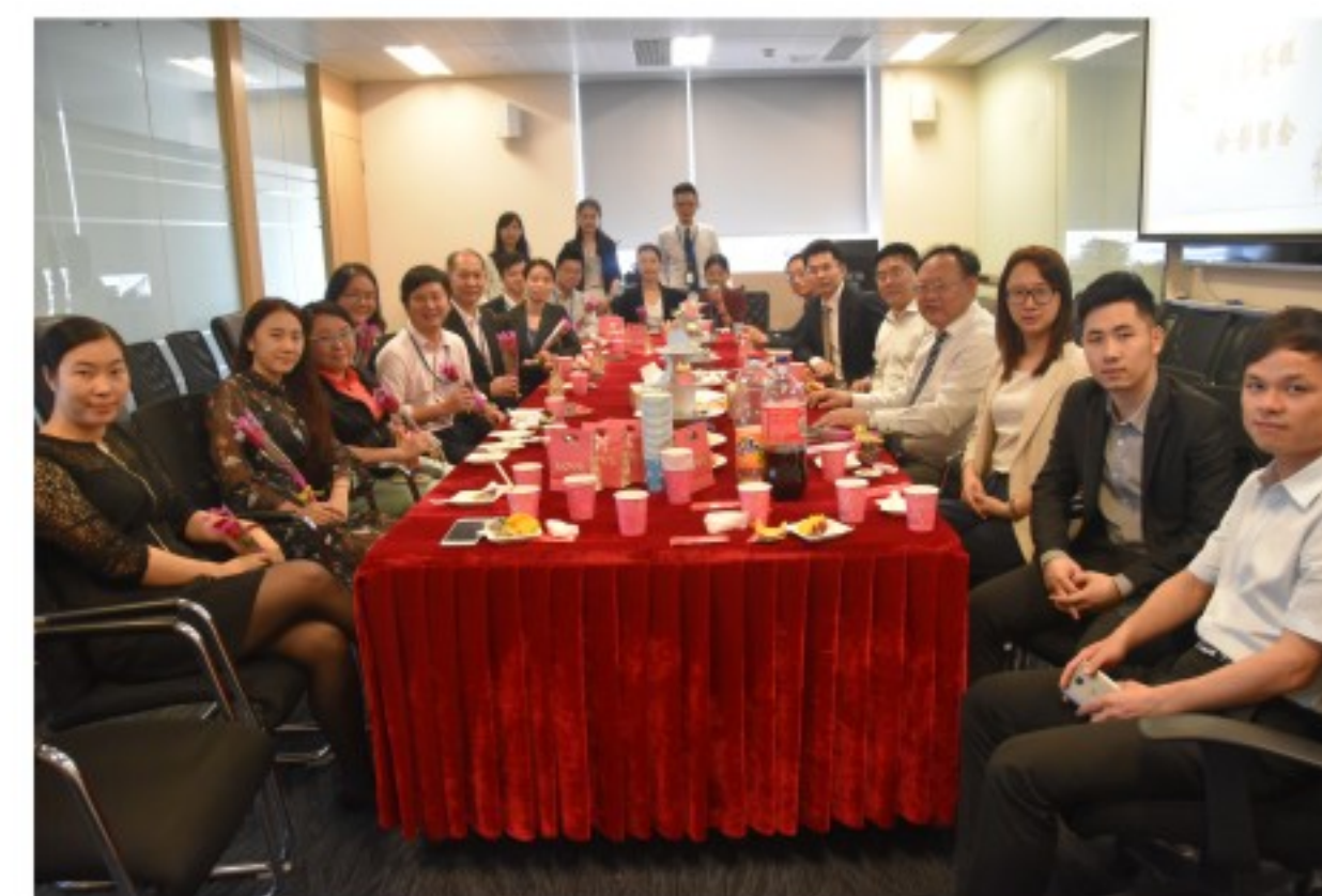
广信君达四月生日会

每场生日会上，都设有“合伙人送祝福”、“齐唱生日歌”、“许愿”、“吹蜡烛”、“切蛋糕”等环节，并特别设计了“派送礼物环节”，由在场的管委会成员、合伙人为寿星们派发精美的小礼物，送上最诚挚的祝福。在繁忙的工作氛围中，欢乐和感动涌入每位广信君达人的