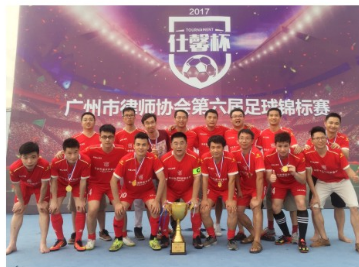
冠军足球队员合影

在这2个多月的赛事中，每一场比赛都可谓跌宕起伏，无论是顺境还是逆境，广信君达人从未放弃拼搏，比赛过程中遇到的种种困难和意外，更是将广信君达人不轻言放弃的拼搏精神展现得淋漓尽致。让我们祝贺广信君达运动健儿们勇夺足球锦标赛冠军，我们为全体运动员顽强拼搏、全力以赴的运动精神欢呼喝彩，全体广信君达人为大家感到骄傲和自豪！