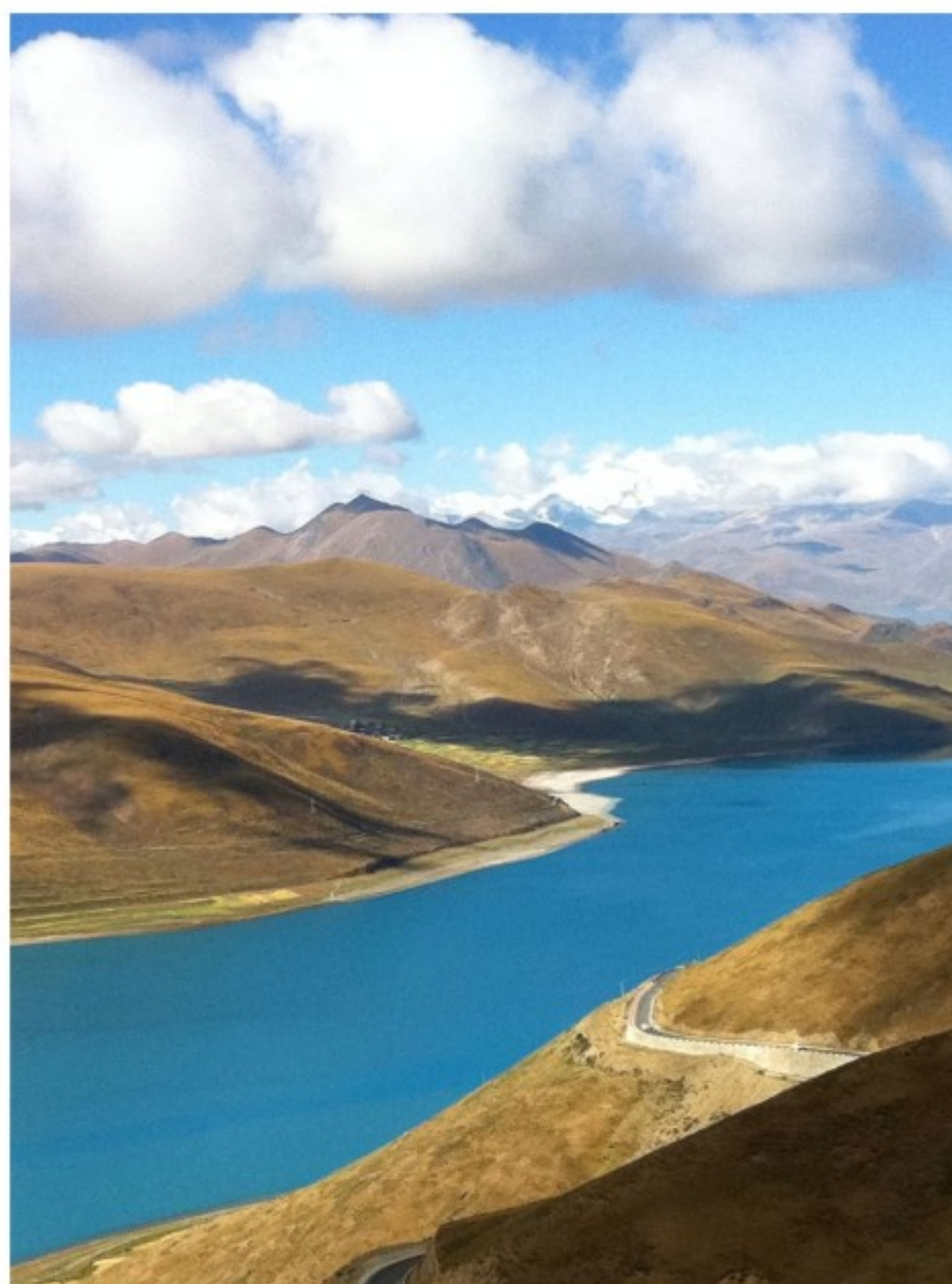
萦纤 一级合伙人 赵芃律师 摄

徐嵩律师，本所合伙人律师，现任广东省人大代表、广东省人大常委会立法咨询专家、监督司法专家；广东省人民检察院规范司法行为监督员，广东省新的社会阶层联谊会常务理事、市新联会律师分会副会长等。徐嵩律师自1997年开始从事律师工作，同时从事专利代理，在知识产权、企业治理、政府行政法律服务、委托立法等领域积累了非常丰富的专业经验。